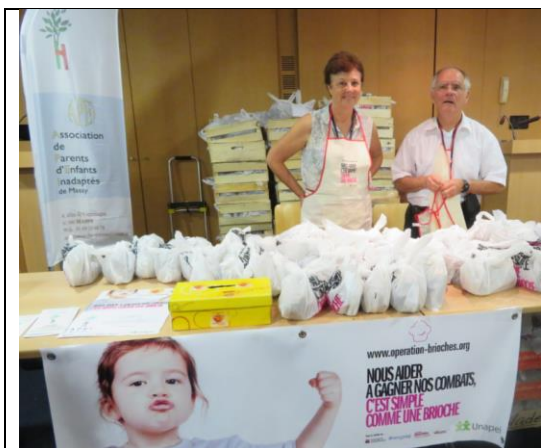
Distribution des Brioche chez Thalès en Octobre à Massy