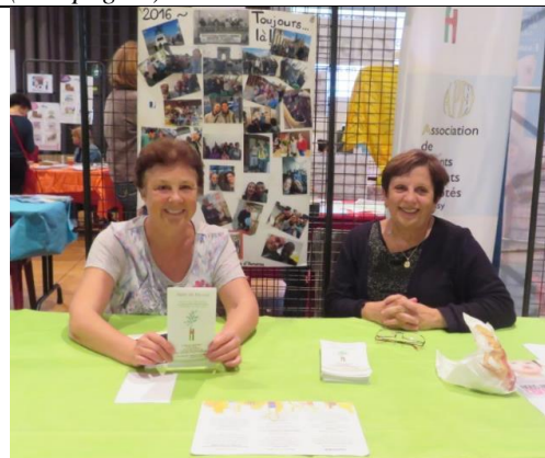
Forum Social 2017 : l'Apei de Massy toujours présente !