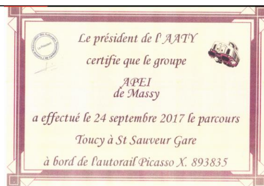
Animations-Rencontres : une journée riche en émotions : Voyage en autorail, repas pantagruélique et visite d'un château médiéval en cours de travaux depuis 20 ans