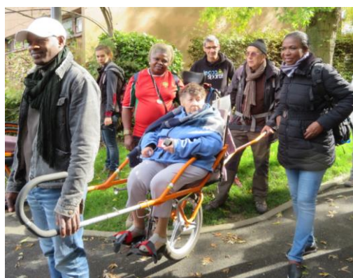
Une randonnée en joëtte durant la semaine de l'autonomie organisée par la Mairie de Massy