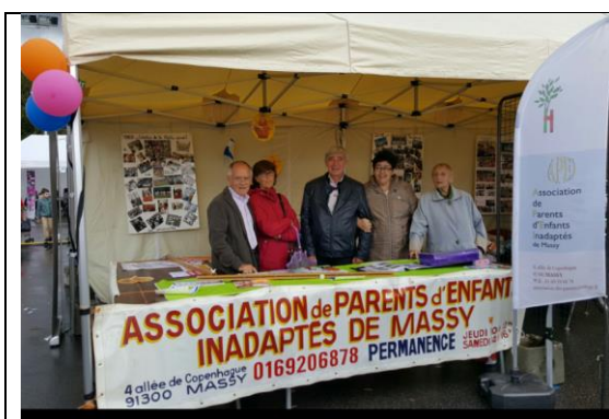
La Fête des Associations de Massy du 10 Septembre. Cette banderole peut être mise aux Archives ! Nous avons une nouvelle carte d'identité de l'association (voir page 1)